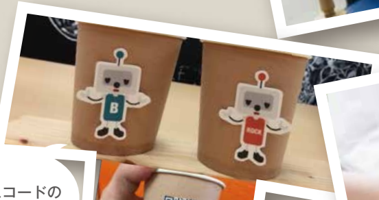
アクセスコードの 拡散